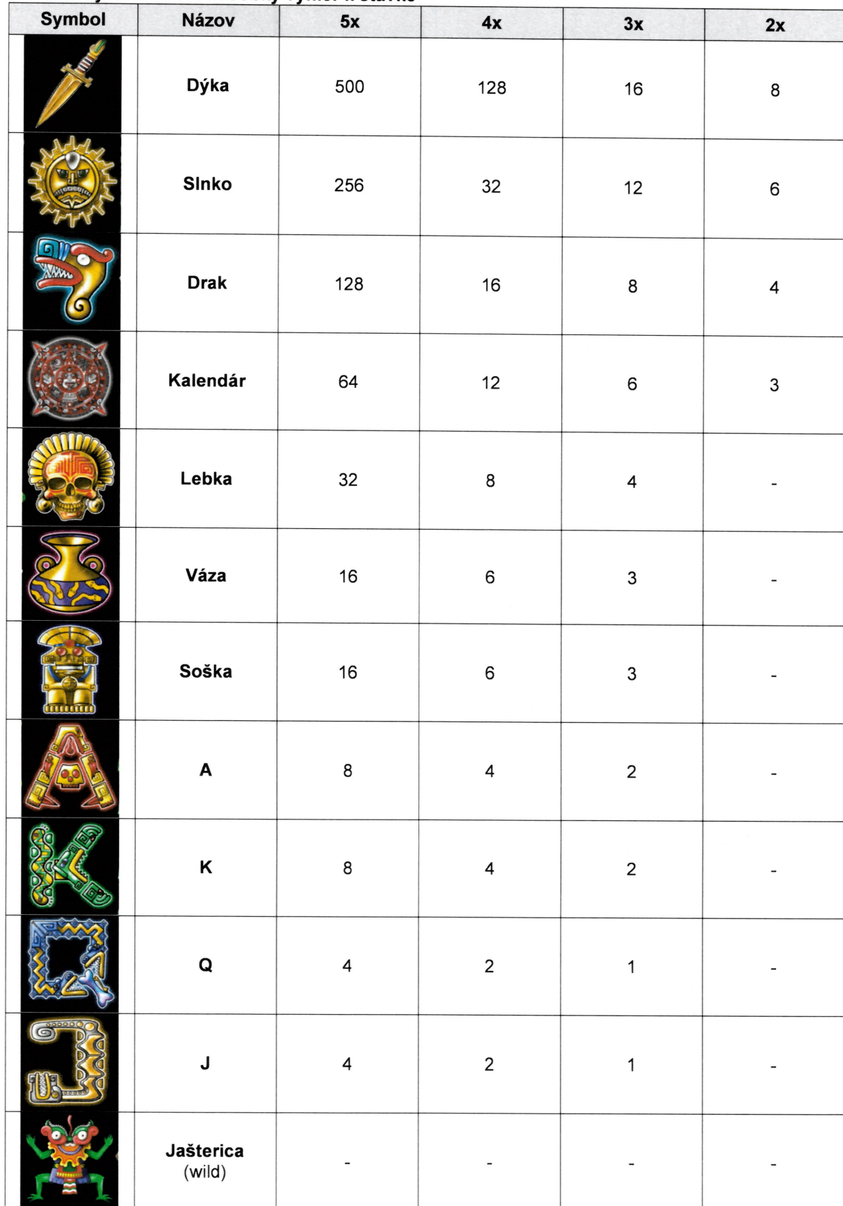
Tabuľka výhier: udáva násobky výhier k stávke